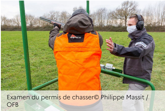
Examen du permis de chasser